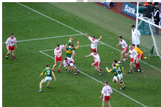
Photo d'un match opposant le comté de Kerry au comté de Tyrone en 2005

Ce sport est basé sur de strictes règles d'amateurisme. Le sommet sportif est la finale du championnat inter-comtés (le All-Ireland Senior Football Championship).