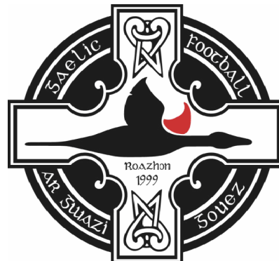
Logo d'Ar Gwazi Gouez le club de Rennes de Football gaélique