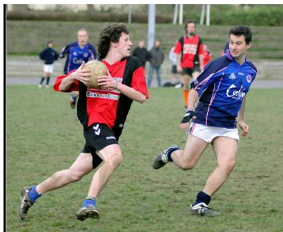
Photo du match Rennes vs Paris lors du tournoi de Rennes le 29 mars 2008 (première manche du championnat européen).

Le club est soutenu financièrement par la Ville de Rennes, le Conseil Général d'Ille et Vilaine et par de nombreux sponsors