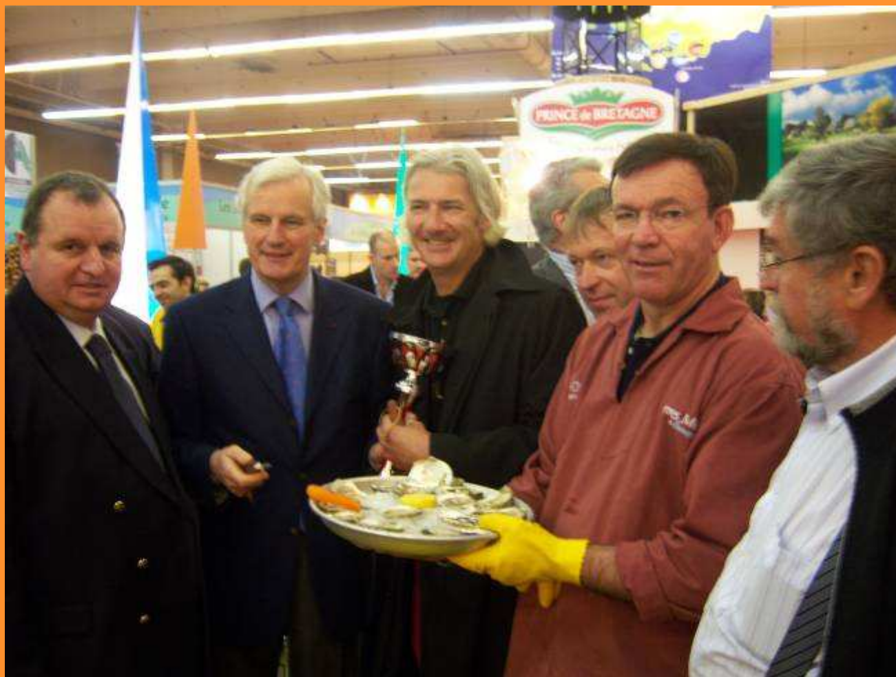
Visite officielle de M. Barnier Vendredi 29 février