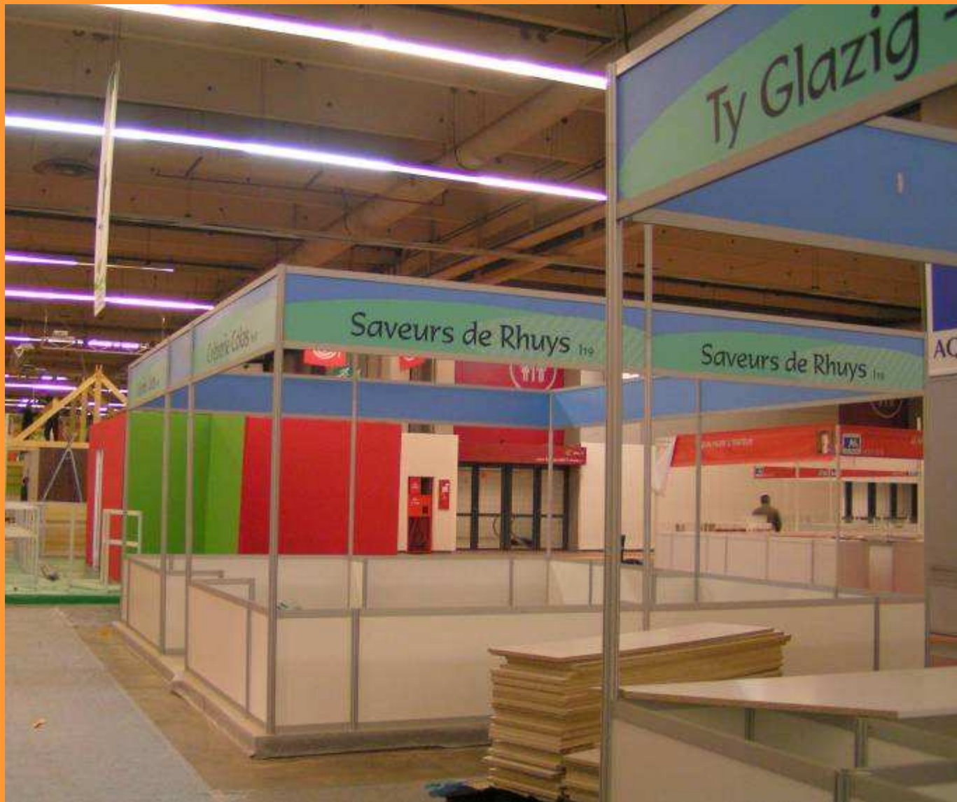
Des stands exposants