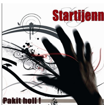
Startijenn PAKIT HOLL (Paker Prod)