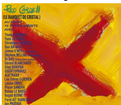
Red Cardell LE BANQUET DE CRISTAL (Keltia Musique)

Cette sélection, on la doit aux 13 membres du jury (4 disquaires, 5 programmeurs de salles de spectacle ou de festival, 4 journalistes) qui ont écouté avec attention les albums en compétition, tous fruits du travail d'artistes et de producteurs installés en Bretagne.