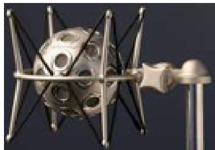
Une sphère HOA à 52 capteurs, sous une forme industrialisée par la société mb-acoustics sous le nom d'EigenMike©, acquise et en cours d'évaluation par Orange Labs

L'enregistrement au format HOA peut être écouté sur un dispositif standard 5.1, ou sur des configurations multi haut-parleurs plus évoluées pour bénéficier de toute la spatialisation, voire sur casque pour une écoute individuelle.