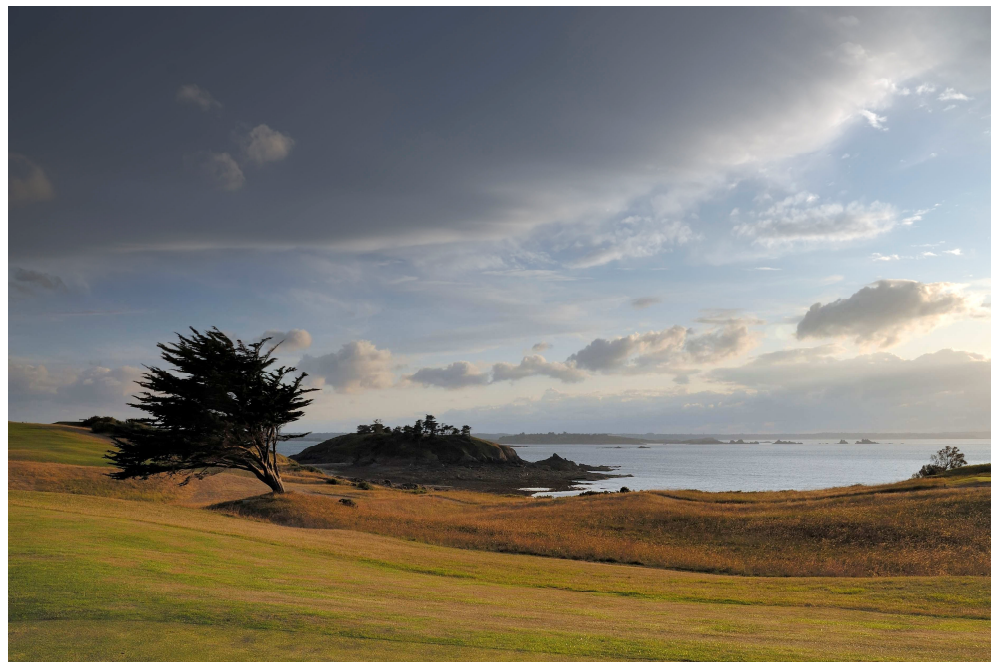
Saint-Briac sur mer

Saint-Briac sur mer est aujourd'hui une commune d'environ 2000 habitants située sur la Côte d'Emeraude, en Ille-et-Vilaine (Bretagne). A la fin du 19 ème siècle, Saint-Briac, jusqu'alors port de pêche et de cabotage, bénéficie des retombées du succès « balnéaire et touristique » de Saint-Malo et Dinard : mais avant le tramway de 1901 et le golf de 1887, avant même le Pont-Aven des années 1888-1890, Saint-Briac a attiré et émerveillé toute une génération de peintres, débutants (Paul Signac, Henri Rivière, Emile Bernard...) ou déjà « installés » dans la notoriété (Auguste Renoir) et devient un lieu privilégié de rencontres estivales, d'inspiration, de recherche et d'innovation artistique : « Saint-Briac, terre d'artistes ».