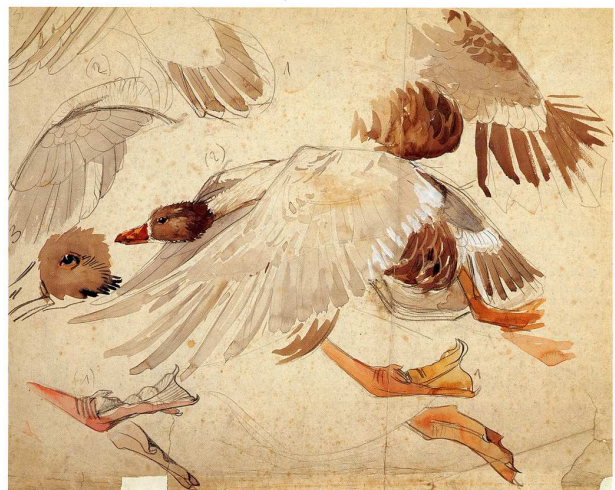
Mathurin Méheut Oie en vol : étude 36.8 x 46 cm Musée Mathurin Méheut, Lamballe

sauterelle vue dans les tranchées sur le front de la Grande Guerre aux animaux d'un cirque croisé en Finistère, des biches sacrées des temples japonais aux chevaux des haras de Lamballe. Du plus petit organisme observé au creux d'un rocher à Roscoff au plus grand mammifère, de l'animal familier au fauve redoutable, mêmes les animaux généralement considérés comme vermine nuisible, tous le captivent et lui inspirent d'innombrables motifs pour ses différents travaux. Il réalise ainsi de véritables descriptions analytiques de la flore et de la faune, dont l'intérêt documentaire est reconnu par les scientifiques.