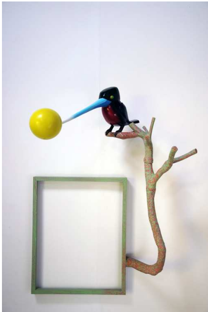
Jean-Yves Brélivet Alchimiste décrochant la lune, [s.d] Série Partir dans le décor Résine polyester et fibre de verre

Depuis des années, ces créatures dansent le Tango des espèces , vaste mouvement orchestré par l'artiste, au sein duquel elles incarnent sa vision, pessimiste, du monde. Jean-Yves Brélivet a choisi le sourire - non la dérision et encore moins le cynisme - pour évoquer un monde effrayant, le nôtre, marqué par une absurde course en avant, que seule une catastrophe (vache folle, grippe aviaire ou porcine...) a le pouvoir d'interrompre brièvement. Les animaux sont les symptômes de l'état du monde et l'artiste en fait ses prolixes messagers.