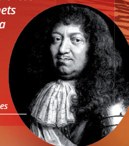
Le Duc De Chaulnes

Une troupe de comédiens ambulants raconte, de bourg en bourg, les révoltes qui secouèrent la région de Bordeaux, en mars 1675 ; puis Rennes, Nantes, Guingamp en avril et mai ; avant d'embraser au son du tocsin, Briec, Châteaulin, Quimper, le Pays Bi- gouden, Saint-Hernin, Carhaix et tout le Centre-Bre- tagne, au cours du printemps des Bonnets Rouges. Tandis que le roi Louis XIV, entre la guerre qu'il mène à la Hollande et les nouvelles alarmantes de la Bretagne, s'amuse à Paris, aux comédies de Mo- lière et aux ballets de Lully. Mais bientôt c'est le glas de l'Automne des Bonnets Rouges qui résonne dans toute la Bretagne : le Duc De Chaulnes secondé par le père Maunoir, entreprend son Tro-Breizh pour réprimer la révolte.