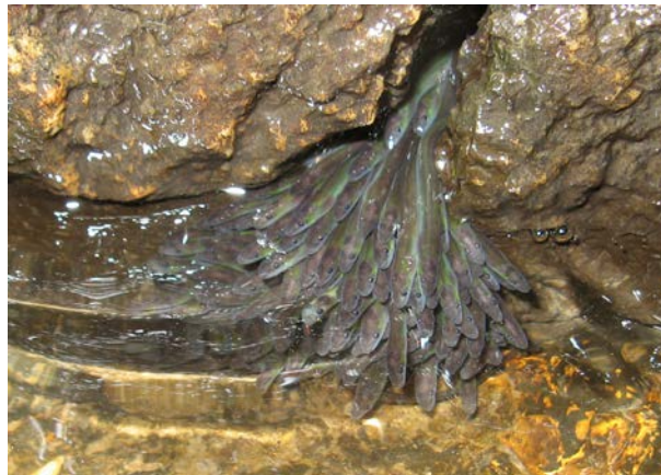
Les civelles de retour à Pont Roux

L'efficacité de la restauration de la continuité des cours d'eau est immédiate. Dès le mois de mai 2014, les habitants de Pont Roux ont pu observer des centaines de civelles, petites anguilles en fin de migration, remonter le Yaudet.