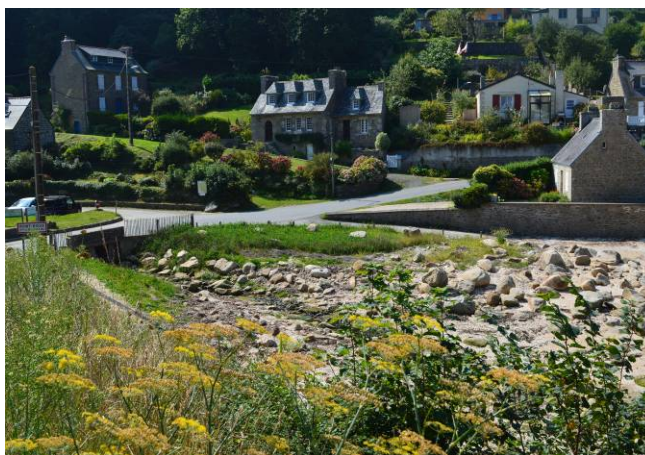
Le cours d'eau du Yaudet sur la Baie de la Vierge avant et après travaux