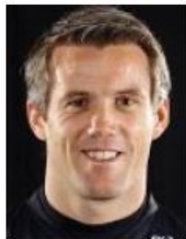
Mickaël Landreau (GK, Bastia)