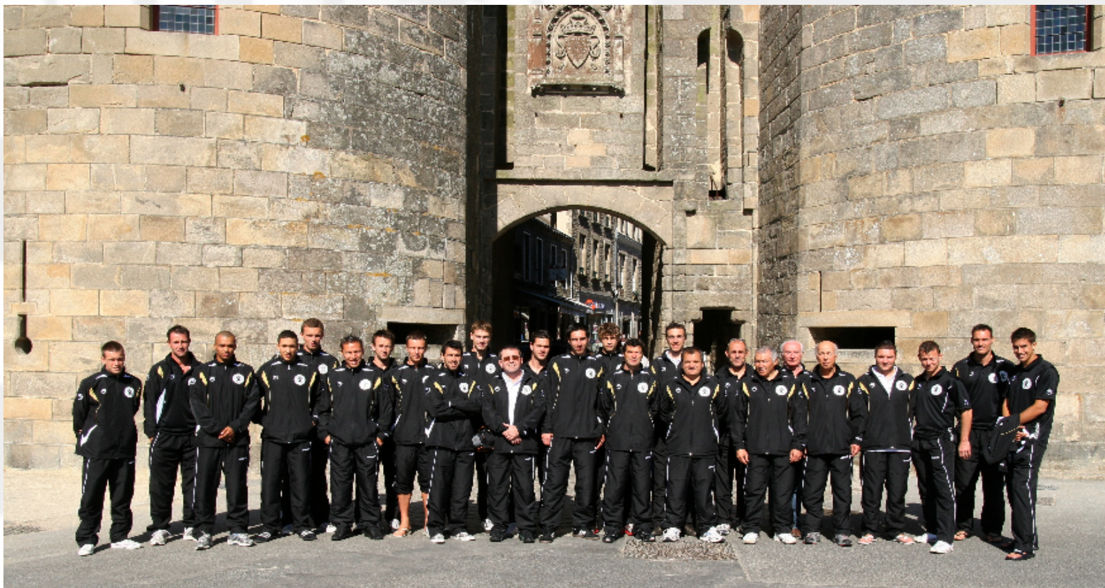
L'équipe de Bretagne avant son match face à la Guinée Equatoriale en 2011, devant les remparts de Guérande, en Loire-Atlantique