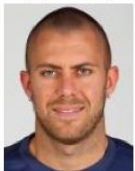
Jeremy Menez (M, Paris)