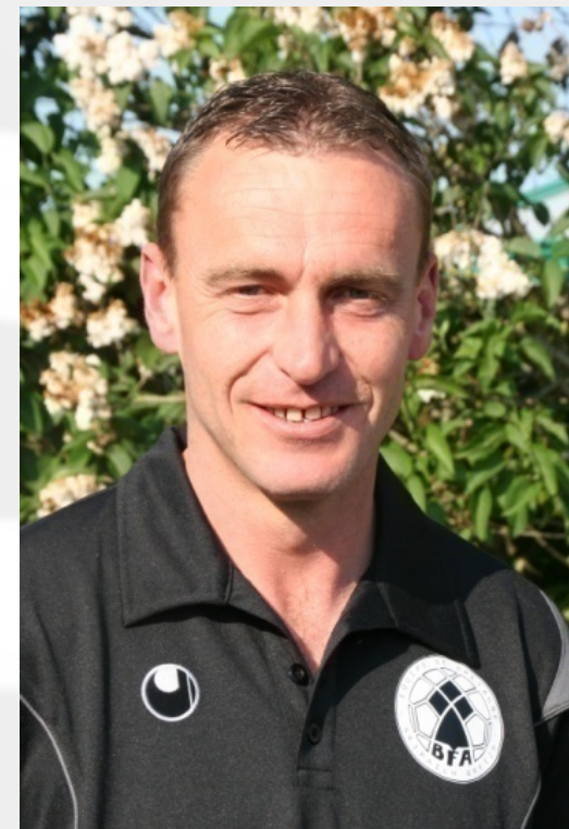
Le champion du monde Stéphane Guivarc'h