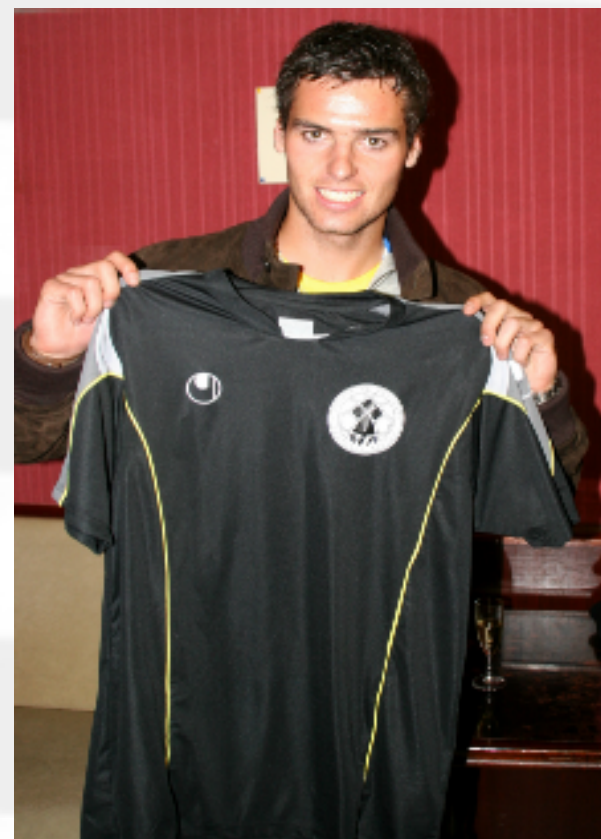
L'international Yoann Gourcuff montre avec fierté le maillot de l'Equipe de Bretagne