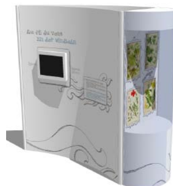
Le vent façonne