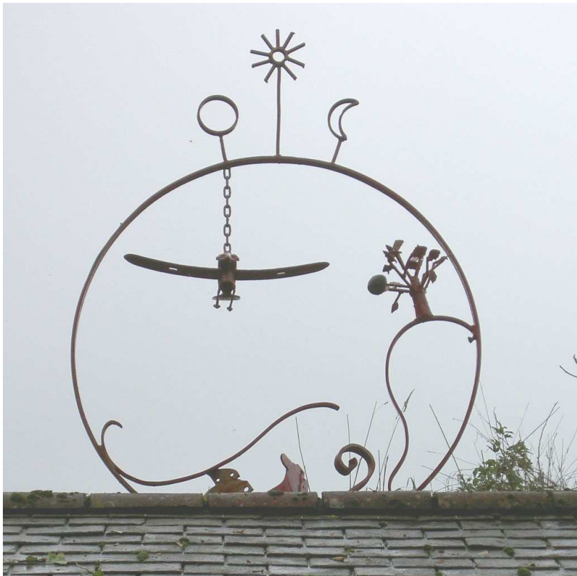
Bed Ruz, monde rouge :