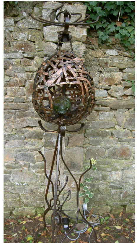
Tonkad, Destin :