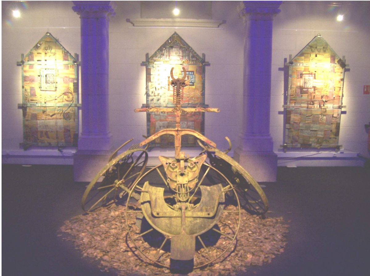
« Le Bouquet d'Agapanthe », Sculpture en acier forgé soudé et céramique, réalisée avec la collaboration de Christophe Mérose pour le Parc Floral de Haute Bretagne, (2008).